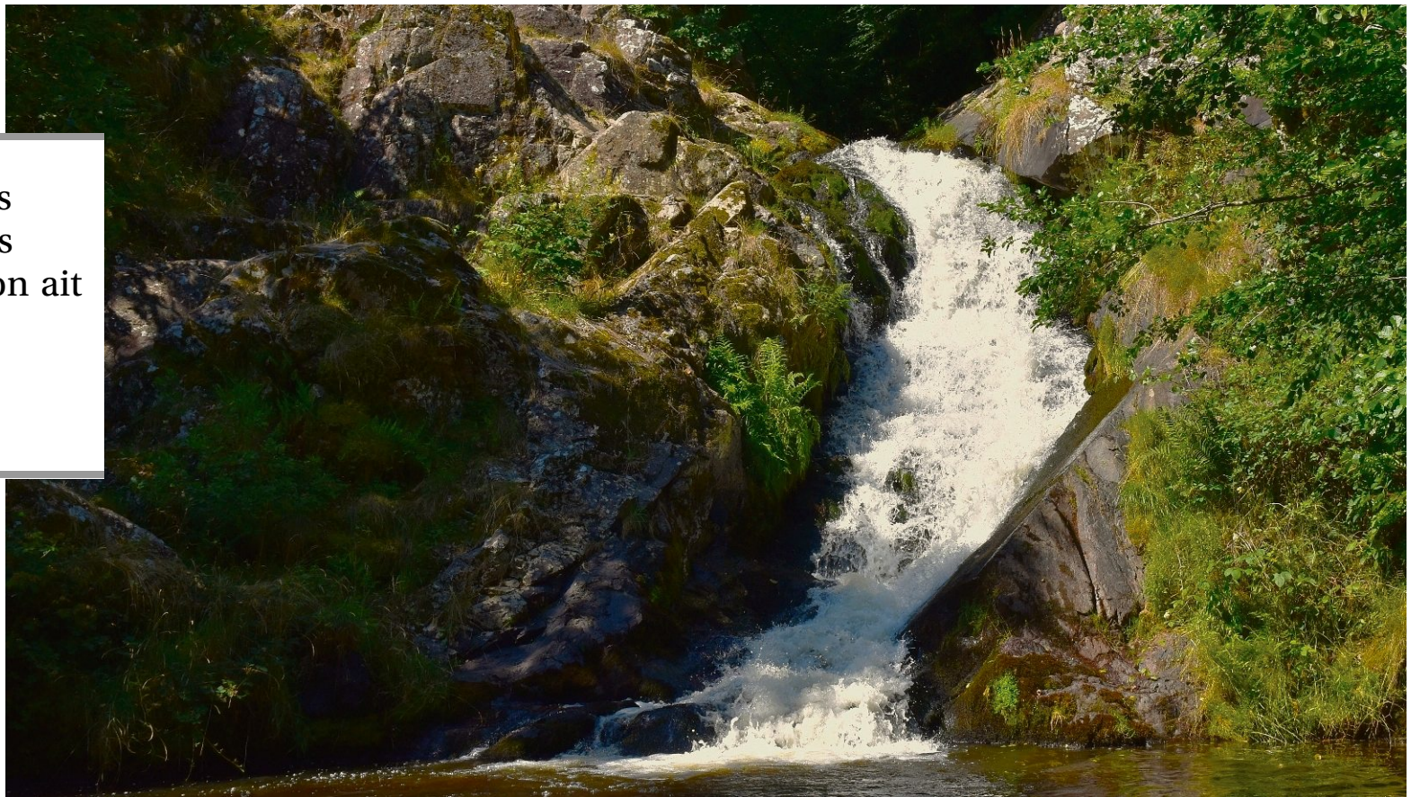
CASCADE. Le chute d'eau de 10 mètres de haut est le clou du spectacle.