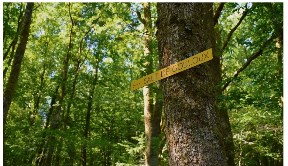
SIGNALÉTIQUE. Pour vous repérer sur le sentier et arriver à la chute d'eau, suivez les panneaux d'indication.