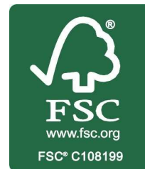
La marque de la gestion forestière responsable